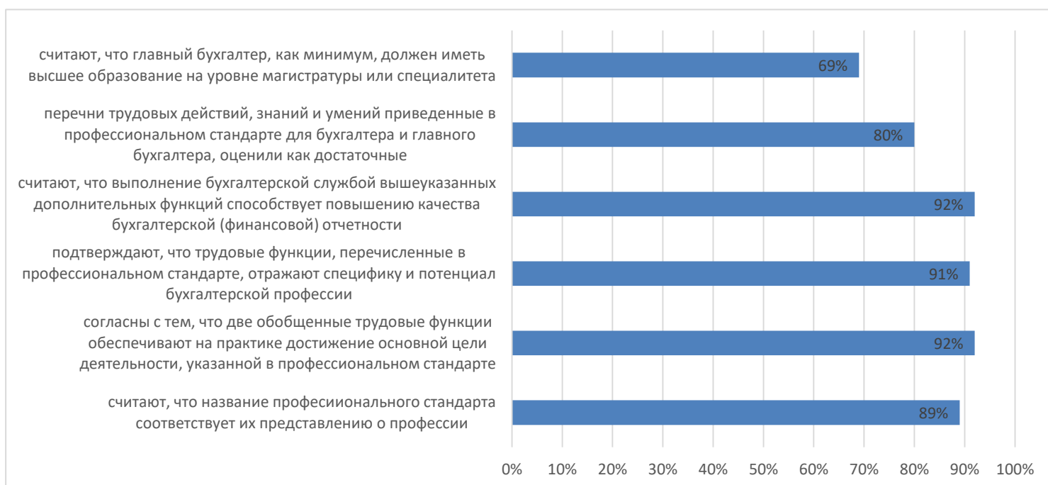
Диаграмма 1. Оценка полноты и качества профессионального стандарта «Бухгалтер»

Основные результаты опроса работодателей представлены на диаграммах 1 и 2.